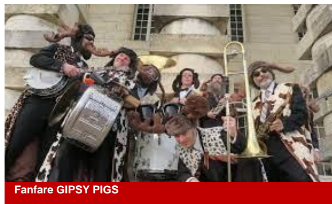
Fanfare GIPSY PIGS