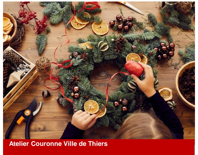
Atelier Couronne Ville de Thiers