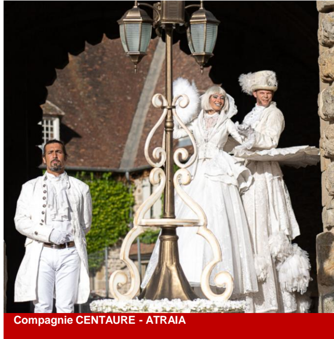
Compagnie CENTAURE - ATRAIA