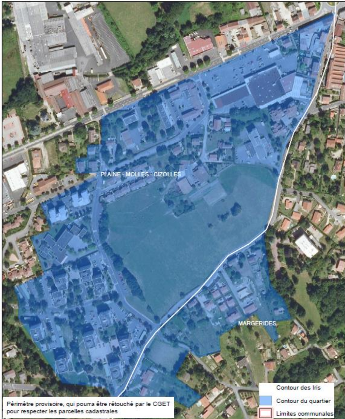
Carte du quartier prioritaire Les Molles Cizolles