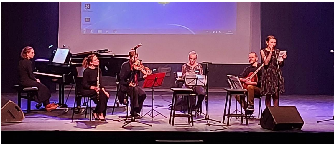
Concert des professeurs du conservatoire au profit des réfugiés Ukrainiens

De son côté, l'établissement apporte son aide logistique et technique.