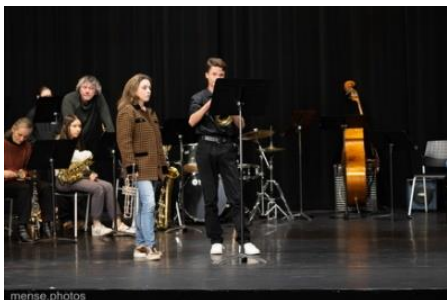
Masterclass Lucienne RENAUDIN-VARY

concert organisé à Thiers par les concerts de Vollore. Les élèves sont invités au concert avec leur professeur et doivent rendre un document d'analyse et de critique comptant dans l'évaluation continue et l'obtention de l'UV culture musicale du BEM. Ce partenariat pourrait être développé d'avantage en proposant par exemple des répétitions publiques pour les élèves du conservatoire, ou des masterclasses avec les artistes invités.